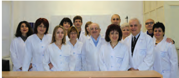
Академичният състав на Катедрата по медицинска биология 2015 г.

Издадената кратка история на Катедрата е поглед към миналото ѝ –