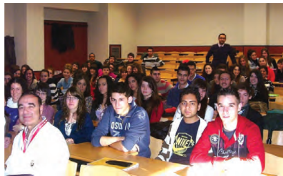
Лекция с „моите“ испански студенти

Катедрата по пародонтология и ЗОЛ винаги е предлагал отлични възможности на тези студентите да развият профе-