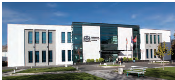
... а сега – в модерен Аудиторен комплекс